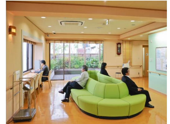
屋上庭園が見渡せるラウンジ

<スタッフ> 医師常勤1名 医師非常勤8名 看護師13名 臨床工学技士7名 管理栄養士2名 看護助手4名 医療事務2名