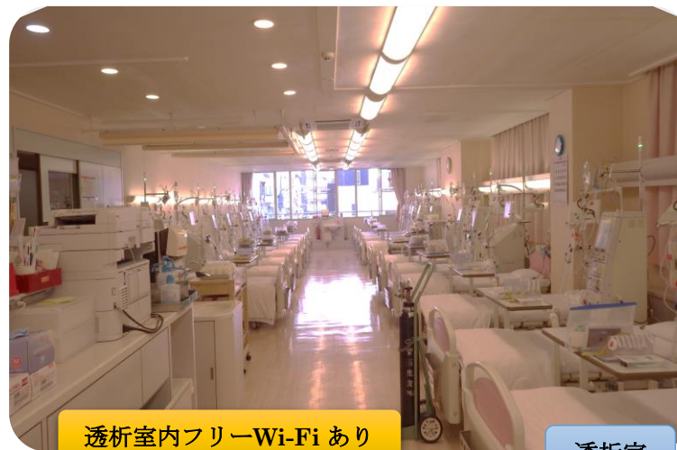
透析室内フリーWi-Fiあり